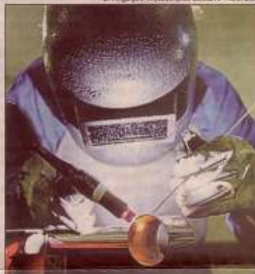
■ A FÁBRICA Metacorpus, em Bonsucesso, é responsável pela fabricação de aparelhos para pilates. A empresa investiu R$ 200 mil em máquinas