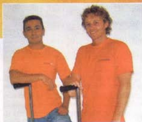
Cunha e Salgado: especialização e profissionalismo garantem clientela